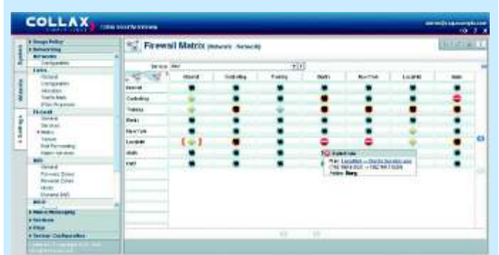
Strutturato e sicuro: la configurazione del firewall attraverso la matrice grafica di semplice utilizzo. Il firewall prende sempre la decisione più giusta e più sicura.

SG Simply Linux - Collax Security Gateway è il vostro specialista per la gestione unificata delle minacce - una soluzione completa per proteggere le vostre reti da tutte le minacce esterne ed interne. Le vostre e-mail vengono controllate per rilevare la presenza di virus, Trojan e spam. Anche l'accesso a siti web può essere filtrato in modo da ridurre gli abusi del servizio Internet aziendale.